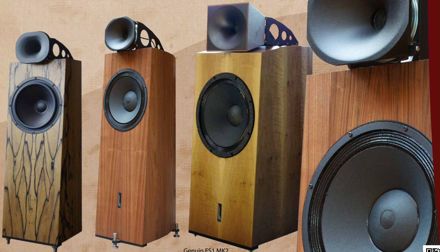
Genuin FS3 MK2